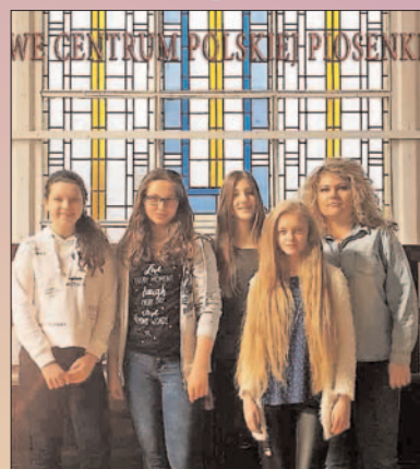
"The Stars" z Gimnazjum nr 2 w Opole