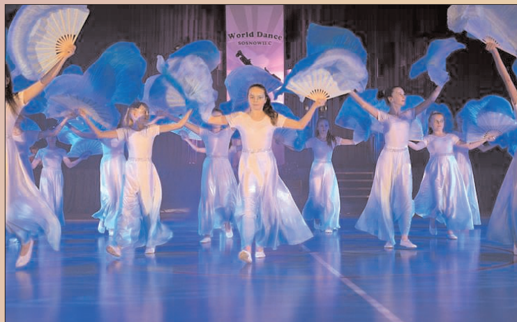
Tancerki zespołu "Karambol" brązowymi medalistkami na Ogólnopolskim Turnieju Tańca Nowoczesnego WORLD DANCE Sosnowiec 2016"