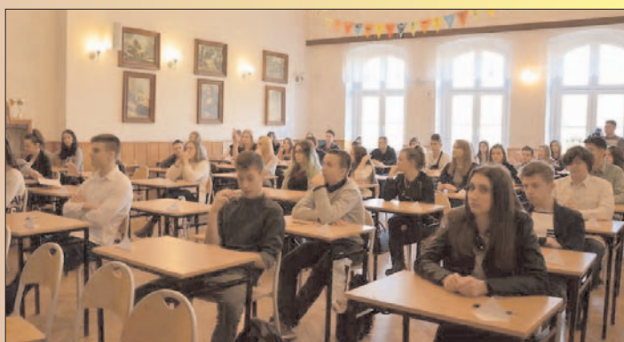
16 marca PZS gościł czwartą edycję międzyszkolnego konkursu języka angielskiego i niemieckiego DENG DENG