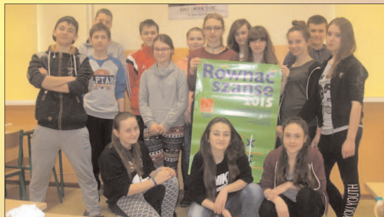
„Na fali” - nowy projekt fundacji „Smak Sukcesu” - Gimnazjum nr 1