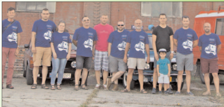
Z cyklu "Ludzie z pasją" - KLUB OLDTIMER Chojnow