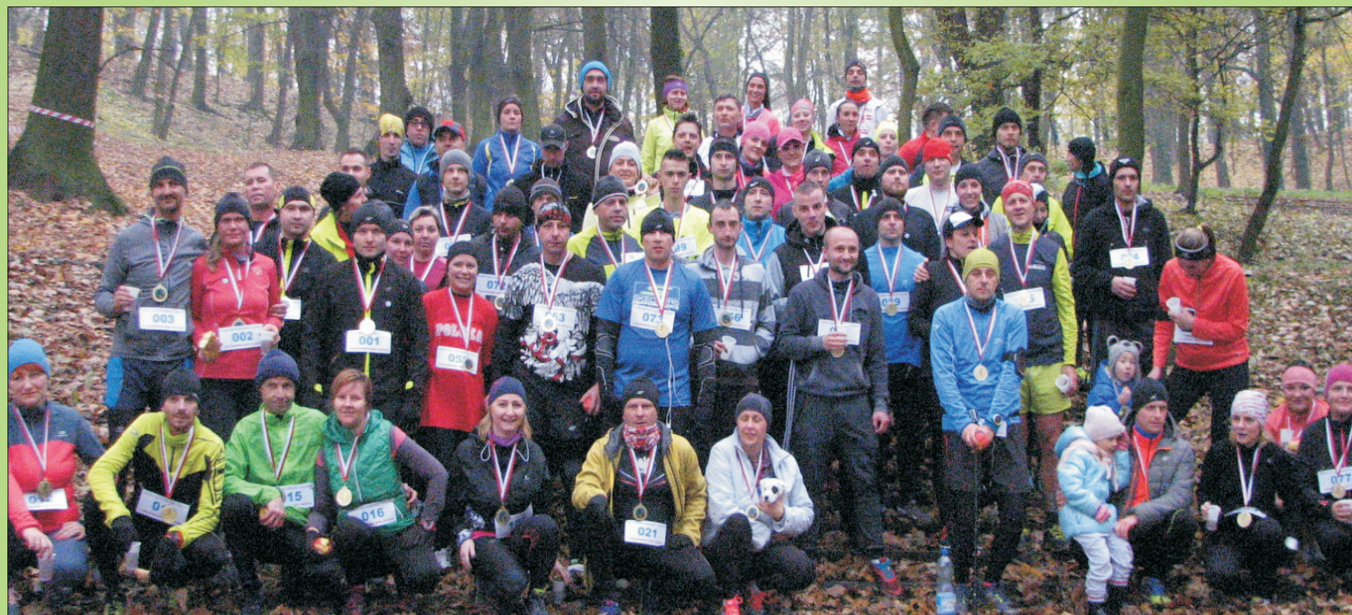
Nowa, sportowa tradycja w Chojnowie - BIEG TKACZA