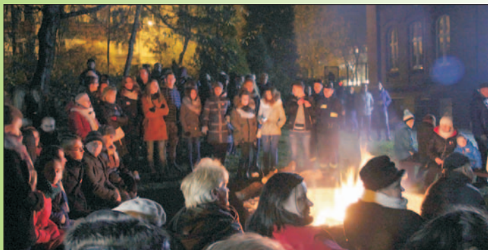
Magia patriotycznego ogniska

Dziękujemy za ofiarę i trud kilku pokoleń rodaków. 11 listopada, to dzień zadumy i refleksji nad wydarzeniami z przeszłości oraz dzień radości i odpowiedzialności za przyszłość. Walczmy każdego dnia o Niepodległą Polskę, zgodną z zasadami, uczciwą i sprawiedliwą.