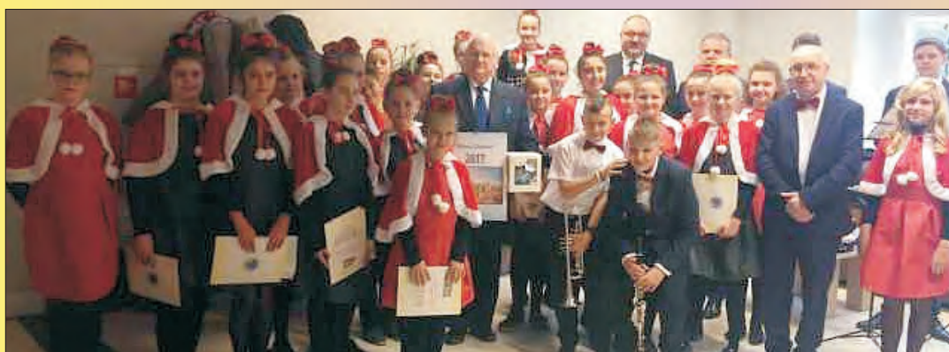
Uczniowie SP 4 z kolędą u władz wojewódzkich