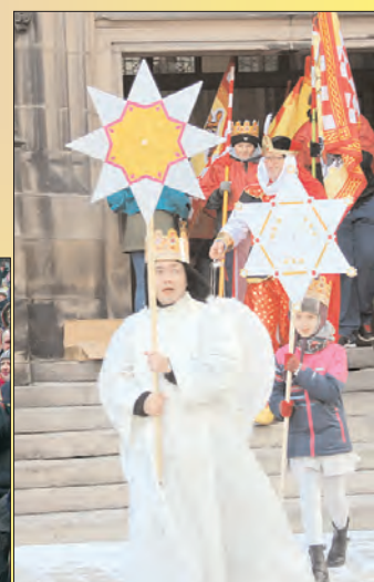
Trzej Królowie pierwszy raz w Chojnowie - w pięknym stylu dołączyliśmy do 515 miast w Polsce.