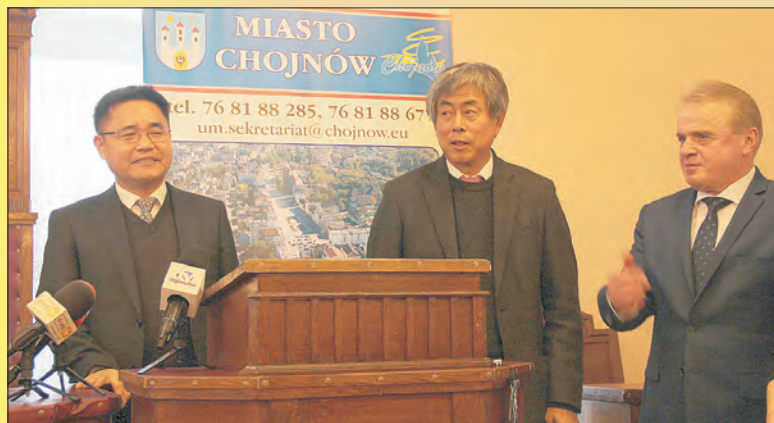
Koreańska firma w Chojnowie Od 5.01. Koncern BMC nowym właścicielem Dolzamet