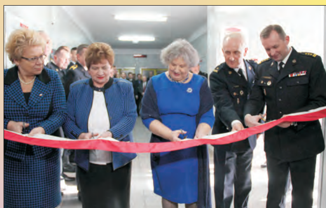
OGNIK dla bezpieczeństwa- ścieżka edukacyjna w JRG nr 3