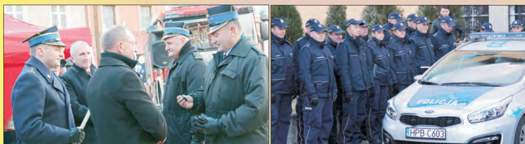
Scania dla strażaków, Kia dla policji