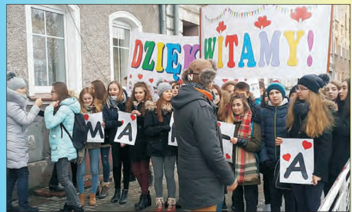
Nasz Nowy Dom w Chojnowie Ekipa Polsatu od 9 stycznia pracowała w naszym mieście.