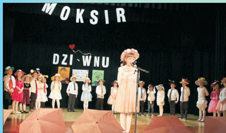
Dzi-Wnu czyli Dzadkom-Wnuki Wspaniały spektakl w MOKSiR, już od 11 lat.