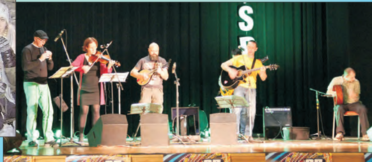
WOŚP - zespół Dagda Point