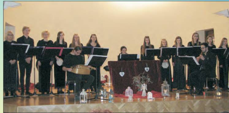
In natali Domini, Gaudent omnes Angeli Pieśni z przełomu epok.