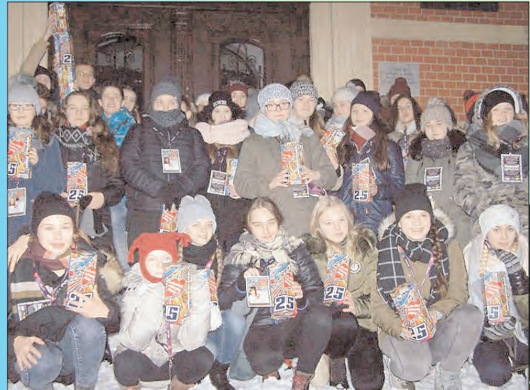
Rekordowa WOŚP Chojnowianie są wspaniali - hojni i wrażliwi.