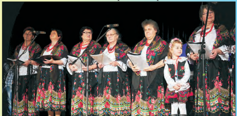
"Z kołędu idziemy..." - barwny koncert w MOKSiR