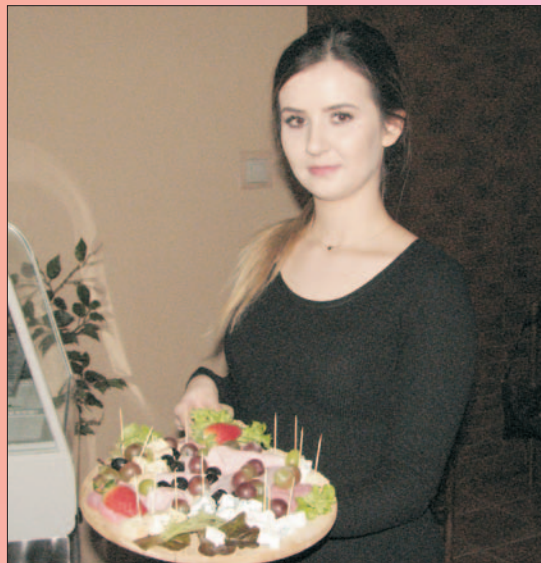
V Festiwal Pizzy 9 lutego obchodziliśmy Międzynarodowy Dzień Pizzy.

Dzięki projektowi unijnemu pozyskano 424 245, 43 zł. Do jego realizacji przystąpiły dwie chojnowskie szkoły - Szkoła Podstawowa nr 3 i Gimnazjum nr 1.