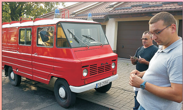
OLDTIMER - żukiem do Kraju Basków