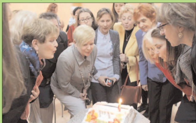
10. rocznica Dyskusyjnego Klubu Książki