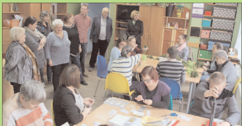
"Sprawni i niepełnosprawni sąsiedzi kształtują Europę"

5 kwietnia Chojnowo było gospodarzem Konwentu wójtów i burmistrzów powiatu legnickiego.