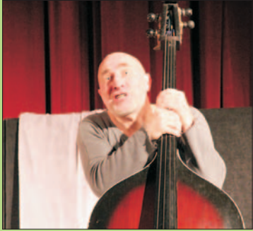
"Kontrabasista" - z Nowego Jorku do Chojnowa

NR 07 (878) ROK XXIV 14.04.2017 CENA 1,70 zł