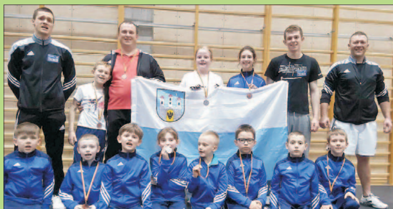
Sukcesy LMKS "SFORA" Chojnowo - 30 razy na podium