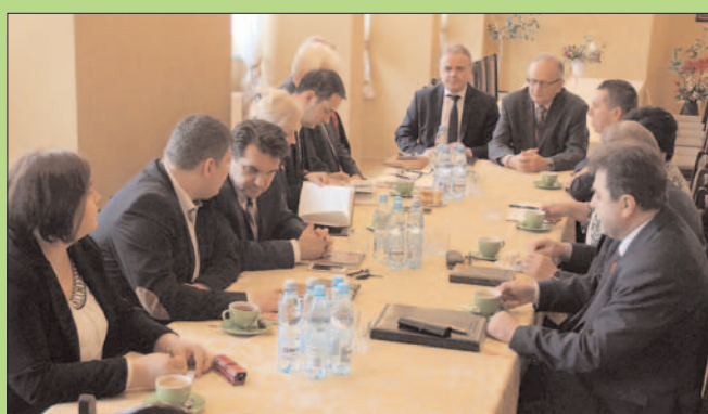
Konwent w Chojnowie

5 kwietnia Chojnowo było gospodarzem Konwentu wójtów i burmistrzów powiatu legnickiego.