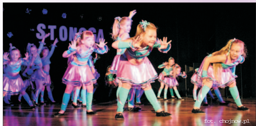
Kilkaset nóg na STONODZE