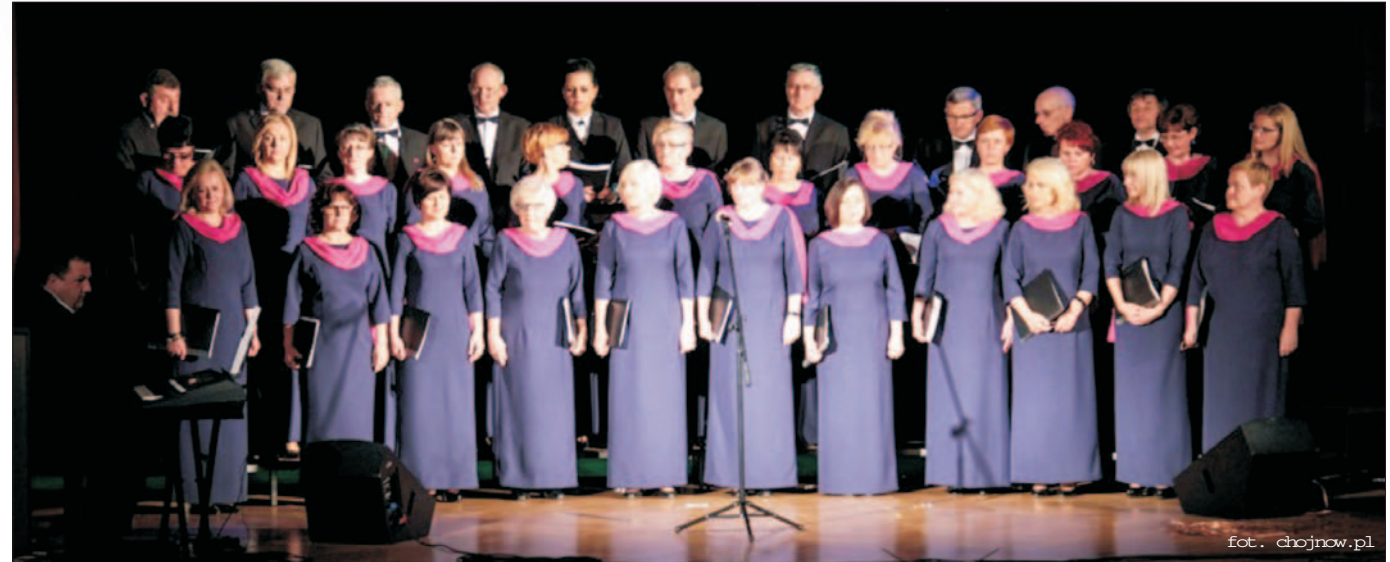
Dzień Matki z MOKSiR