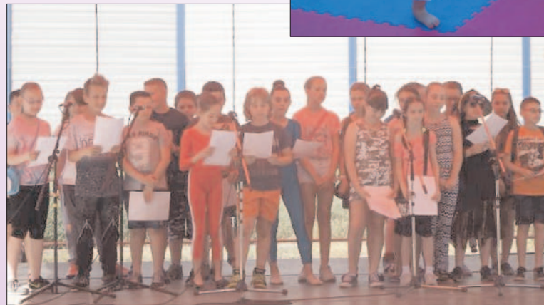
Majowy Festyn Trójki