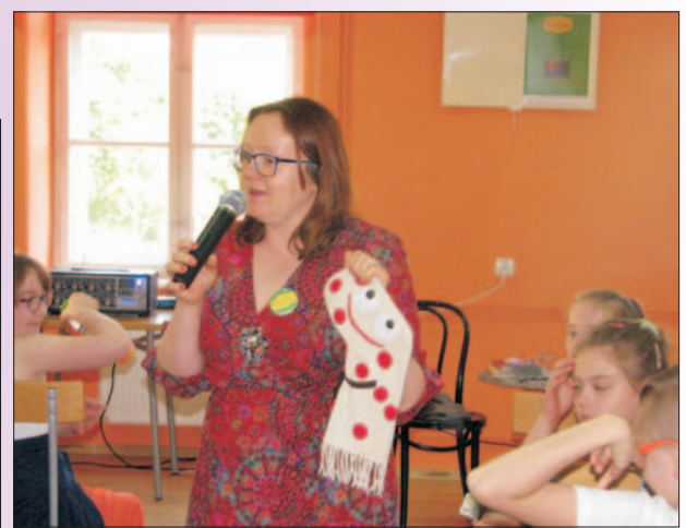
Raz, dwa i trzy - spotkania autorskie w MBP