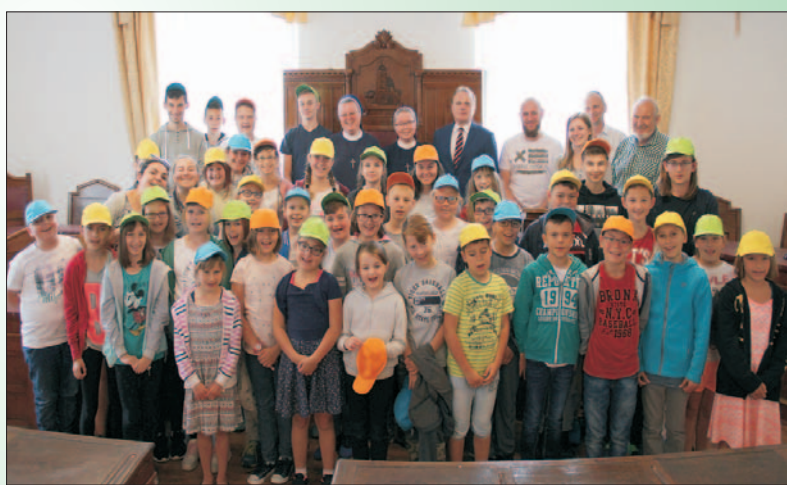
Odziedziny kolonistów ze Stalowej Woli