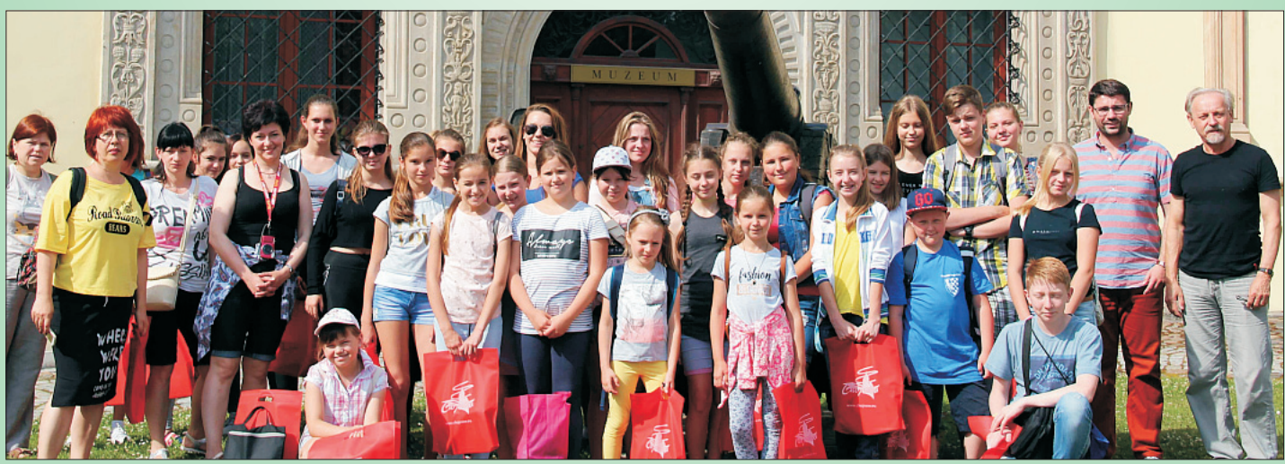
Polskie dzieci z Ukrainy w Chojnowie