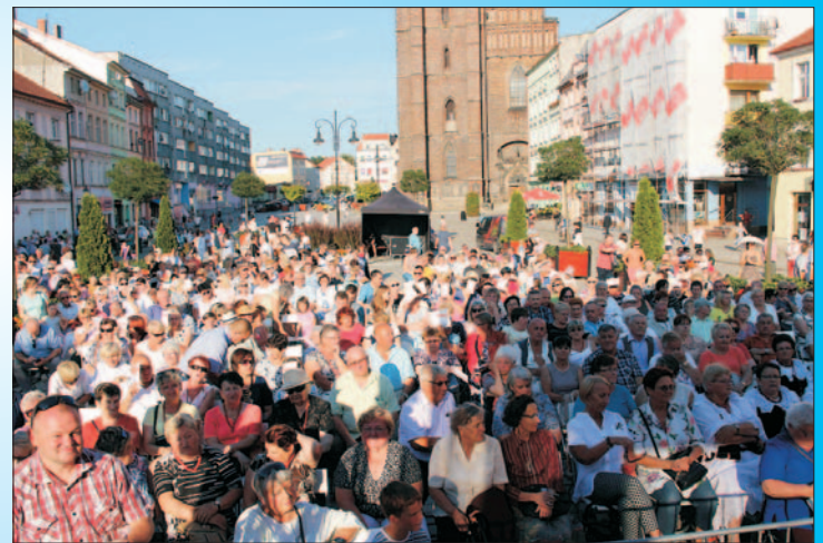
Święto Wojska Polskiego oraz Imieninowe spotkanie Marii, Maryś, Marysieniek...