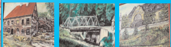
Egelsbach - to już piąty raz!