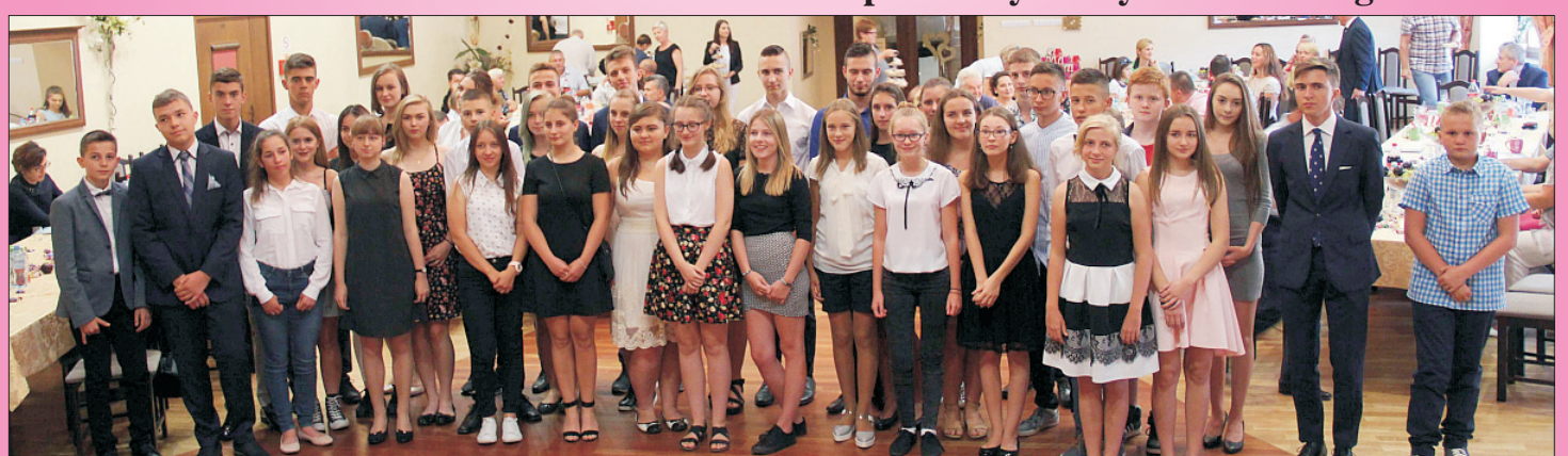
Stypendia i Nagrody Burmistrza dla najlepszych