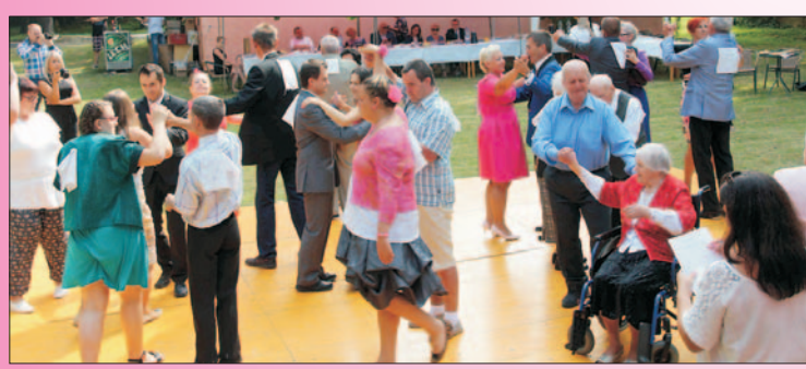
Wielkie show w Parasolu