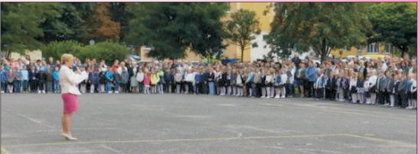
Nowy rok szkolny - nowe wyzwania