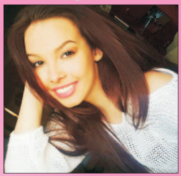
Z cyklu "Ludzie z pasją" Gabriela Zenka

NR 16 (887) ROK XXV 08.09.2017 CENA 1,70 zł