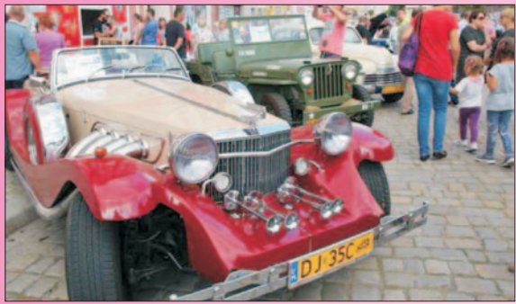
II Rajd Złot Pojazdów Zabytkowych

NR 16 (887) ROK XXV 08.09.2017 CENA 1,70 zł