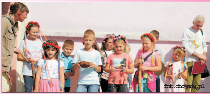
Narodowe Czytanie - happening w mieście - zapraszamy do Rynku 08.09. o godz. 16.00