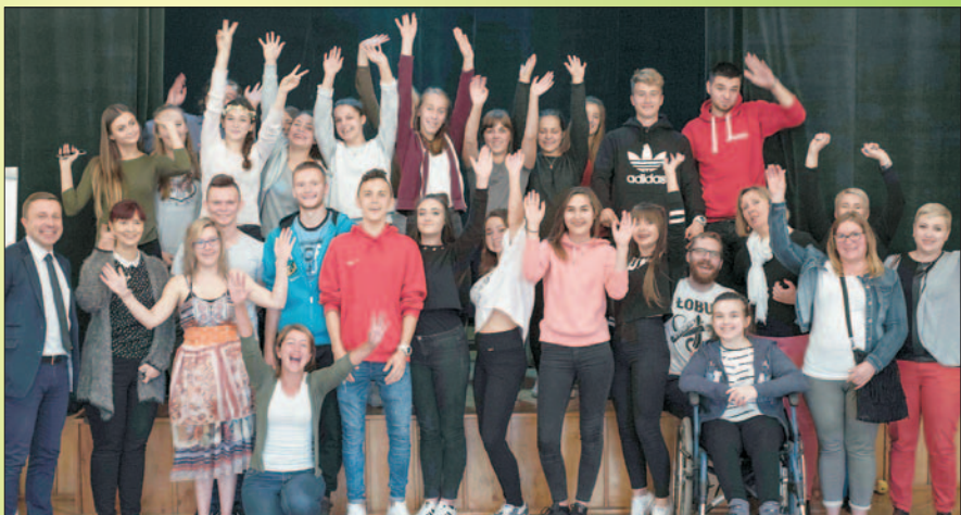
Teatr w drodze - przystanek Chojnów