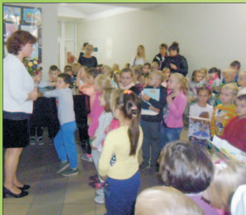
"Od bajki do bajki" Wernisaż prac i rozstrzygnięcie konkursu w MBP

NR 18 (839) ROK XXV 06.10.2017 CENA 1,70 zł