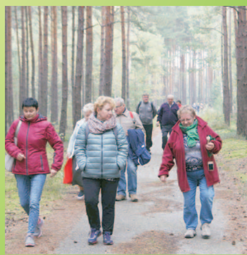
Pieszko przez Wrzosową Krainę