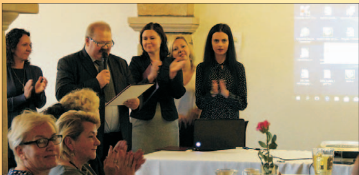
8 projektów w kilka miesięcy