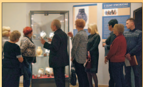
"Ceramika bolesławiecka" - nowa wystawa w muzeum