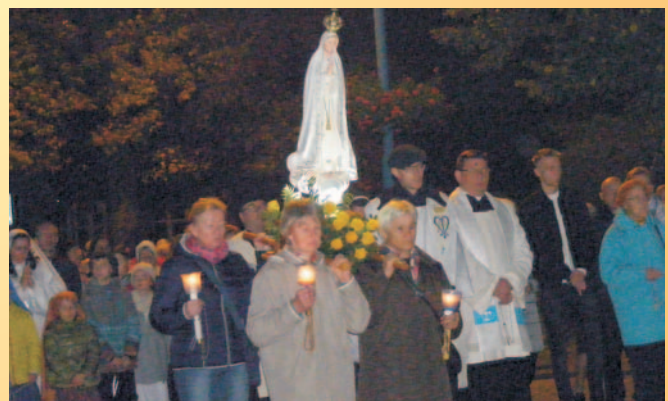
100-lecie Fatimy w Chojnowie