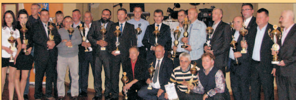
Święto hodowców gołębi