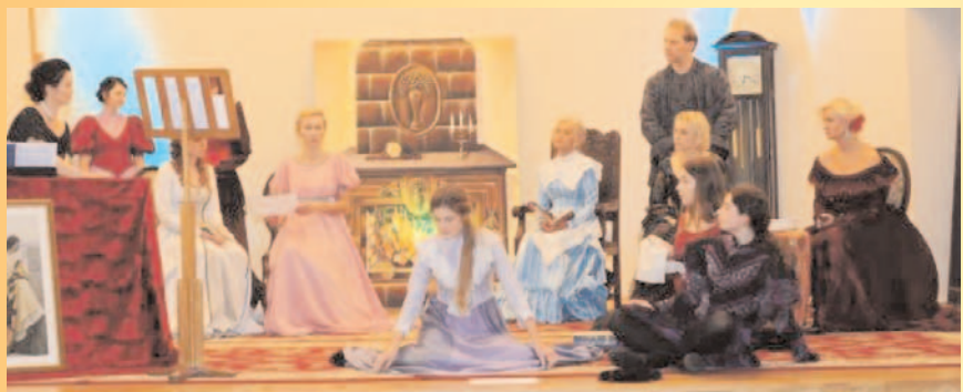
"Lekcja muzyki w dawnym salonie" - Chojnowska Jesień z Muzyką Dawną w MOKSiR