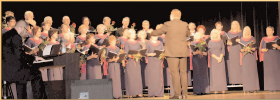
Skoranta ma 10 lat