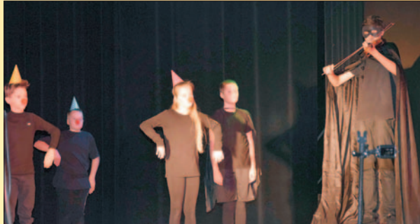
"Od bajki do bajki" - wielki finał projektu