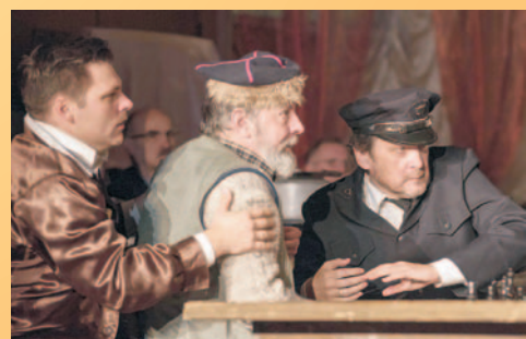
Teatr w Jubilatce