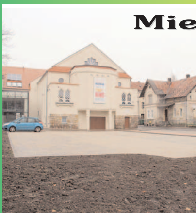
Budowa parkingu przy MOKSiR