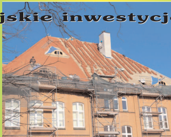
Remont dachu Gimnazjum nr 1