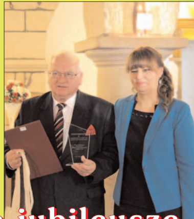
Środowiskowy Dom Samopomocy nr 1