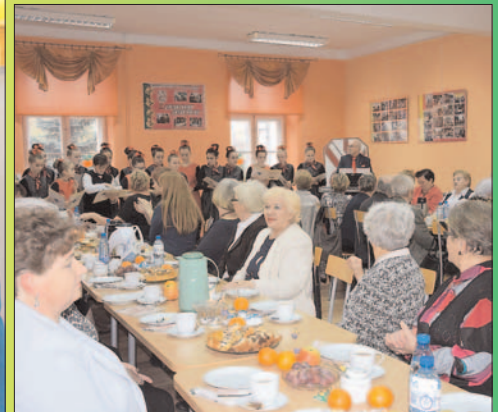
Sekcja Emerytów i Rencistów Związku Nauczycielstwa Polskiego