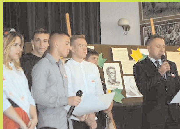
Tydzień Patriotyzmu w PZS