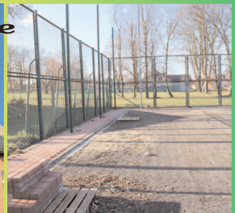
Remont boiska przy stadionie