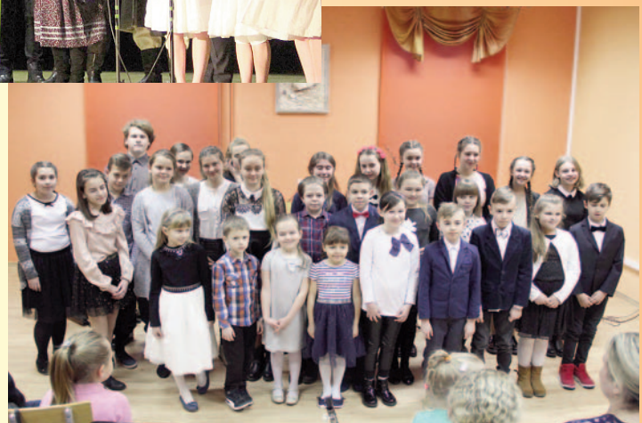
Ognisko Muzyczne - koncert noworoczny