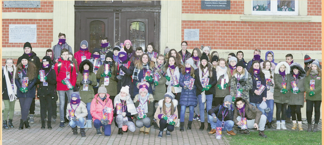
26 Finał WOŚP - mamy kolejny rekord