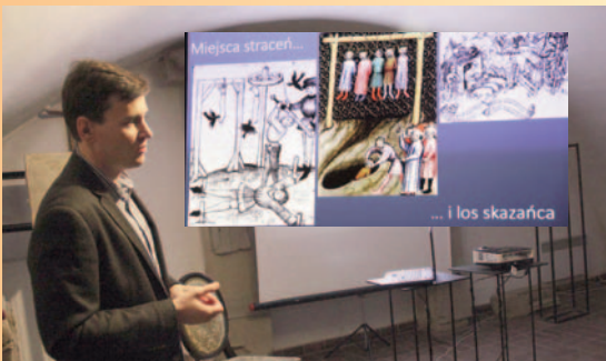
Doktor Duma o miejscach straceń na Dolnym Śląsku