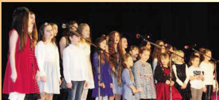
Dziecięca Bombonierka Muzyczna