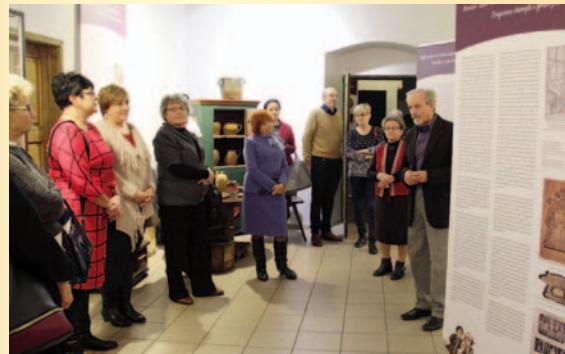
Pierniki - podróż do krainy zmysłów