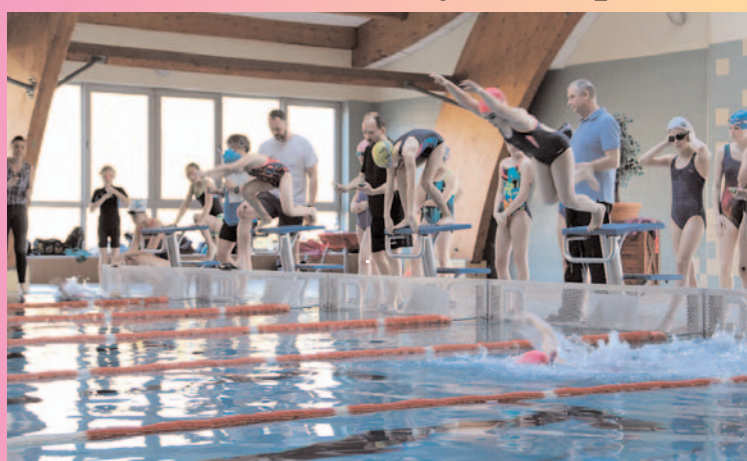
Final Strefy Legnickiej w Sztafetach Pływackich w Chojnowie