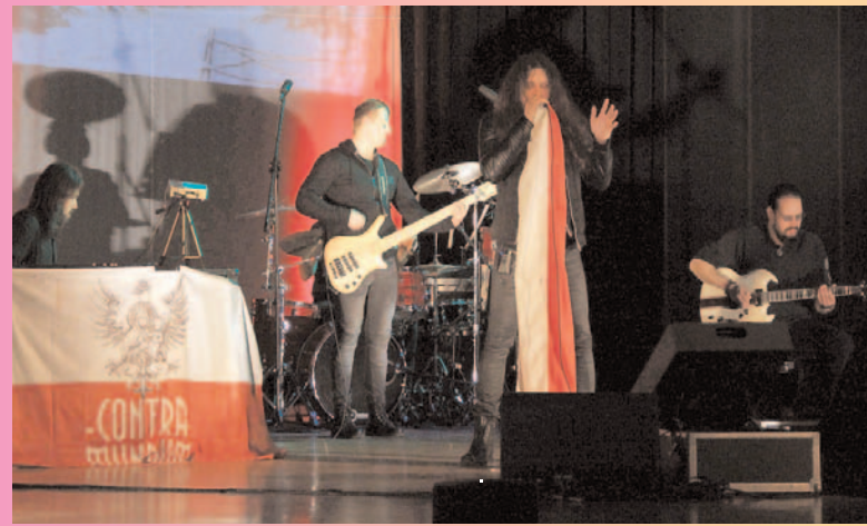
Powiatowy Zespół Szkół - inauguracja obchodów 100. rocznicy odzyskania przez Polskę niepodległości