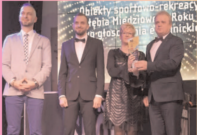
Nagroda dla chojnowskiego basenu - I miejsce w plebiscycie Obiekt sportowo-rekreacyjny Zagłębia Miedziowego 2017

NR 04 (898) ROK XXVI 23.02.2018 CENA 1,70 zł