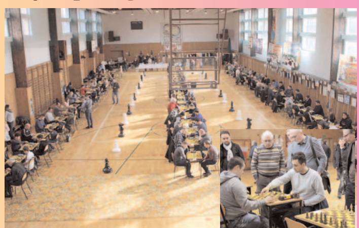
Zmagania w „królewskiej grze” po raz siódmy