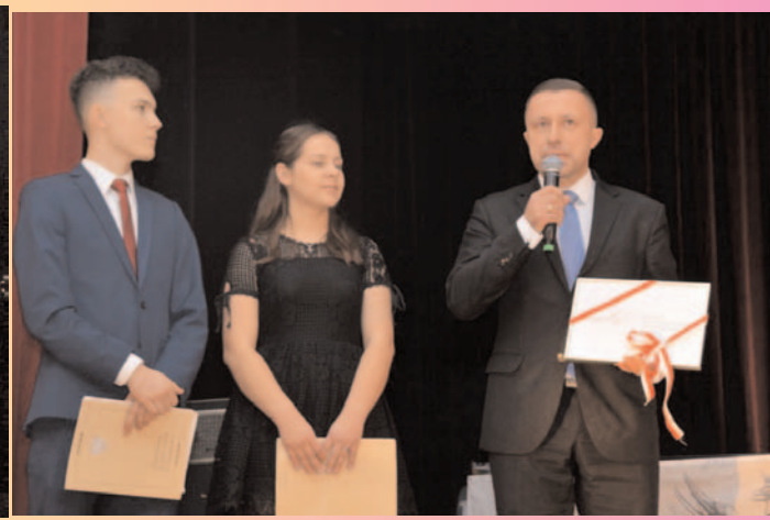
Powiatowy Zespół Szkół - inauguracja obchodów 100. rocznicy odzyskania przez Polskę niepodległości