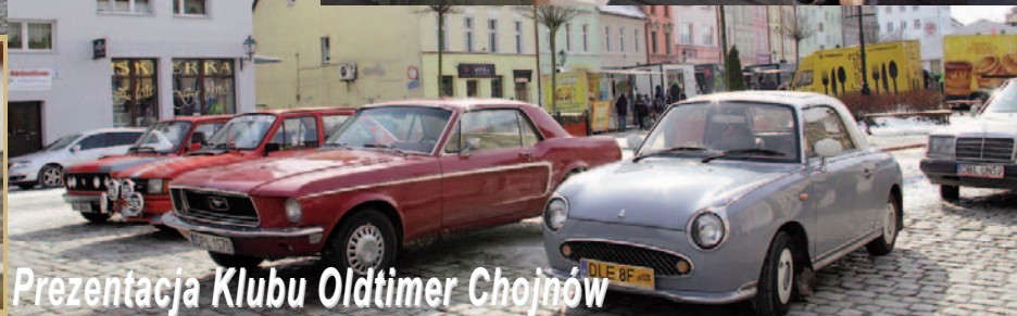
Prezentacja Klubu Oldtimer Chojnow