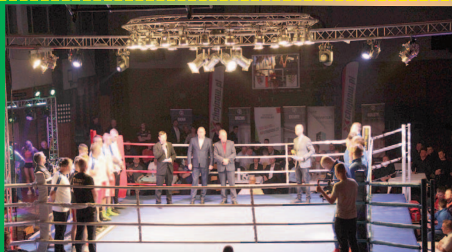
Inauguracja Ekstra Ligi Boksu Olimpijskiego