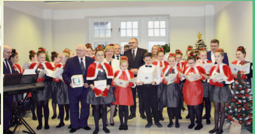
Marzenia się spełniają - „Chile 2017”