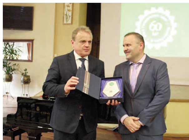
60.olecie Stowarzyszenia Inżynierów i Techników Mechaników Polskich w Chojnowie