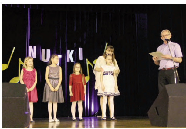
Na ogólnopolskim konkursie