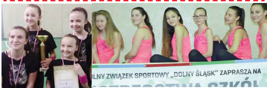
Mistrzyni Dolnego Śląska w Aerobiku Rekreacyjnym

OLNY ZWIĄZEK SPORTOWY „DOLNY ŚLĄSK” ZAPRASZA NA ...SZKÓŁ