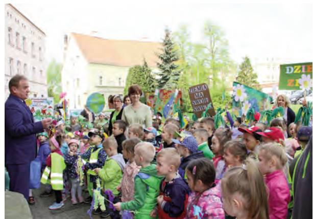
22 kwietnia obchodziliśmy Dzień Ziemi!