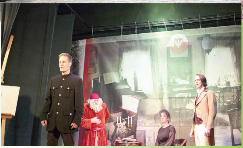
100 spektakli na 100. lecie niepodległości „Zawsze na przdzie” w PZS