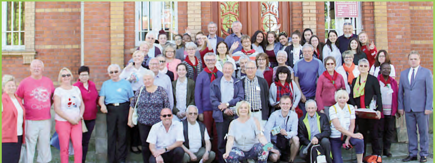
Goście z Francji