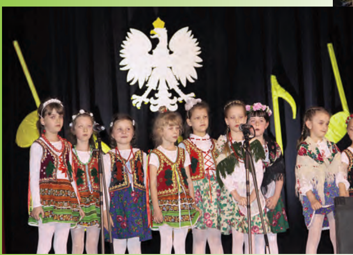
Koncert „Nuty o Ojczyźnie” w MOKSiR