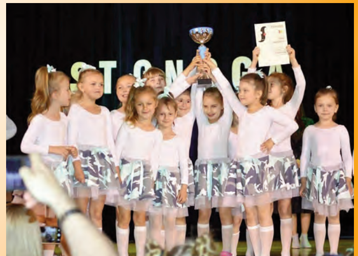
Stonoga 19. raz