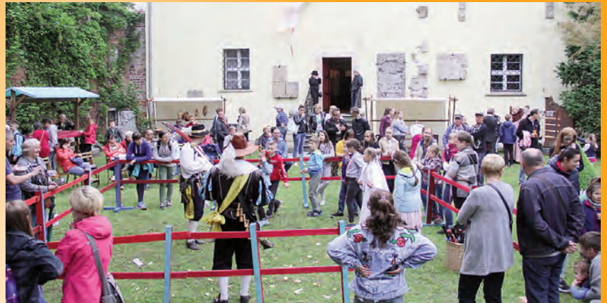
VII chojnowska Noc Muzeów