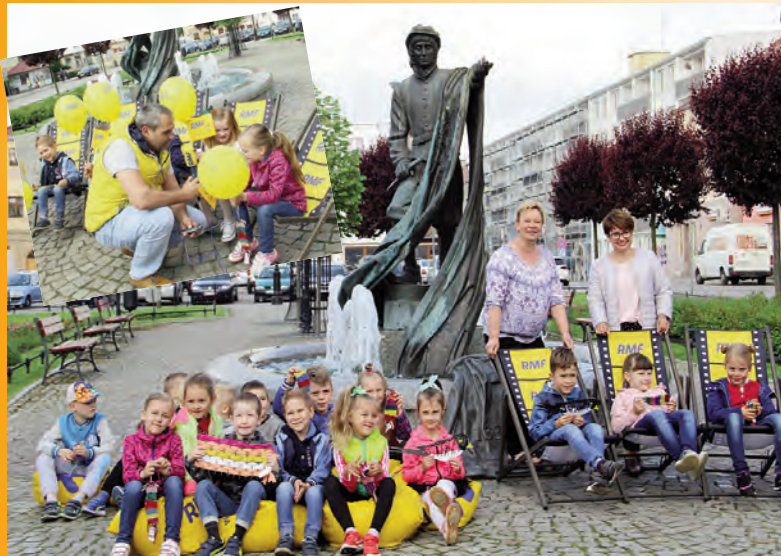
Chojnów na szlaku RMF FM