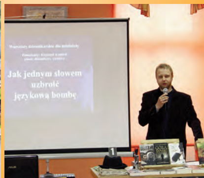
„Warto i oplaca się myśleć” – dziennikarska szkoła jazdy w Miejskiej Bibliotece Publicznej