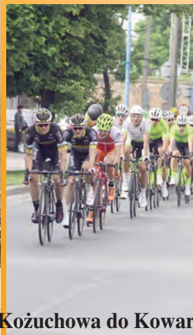
...z Kozuchowa do Kowar