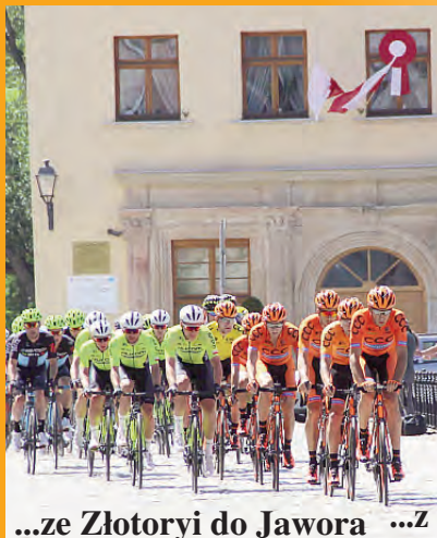
...ze Złotoryi do Jawora