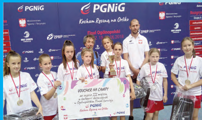
III miejsce w Polsce dla chojnowskich szczypiornistek