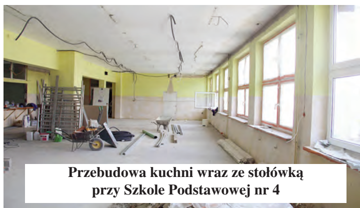
Przebudowa kuchni wraz ze stołówką przy Szkole Podstawowej nr 4