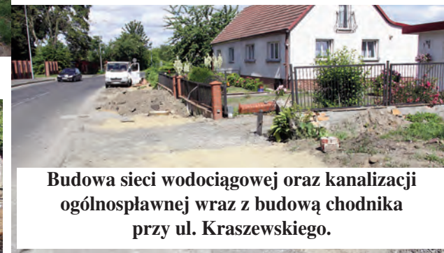
Budowa sieci wodociągowej oraz kanalizacji ogólnospławnej wraz z budową chodnika przy ul. Kraszewskiego.