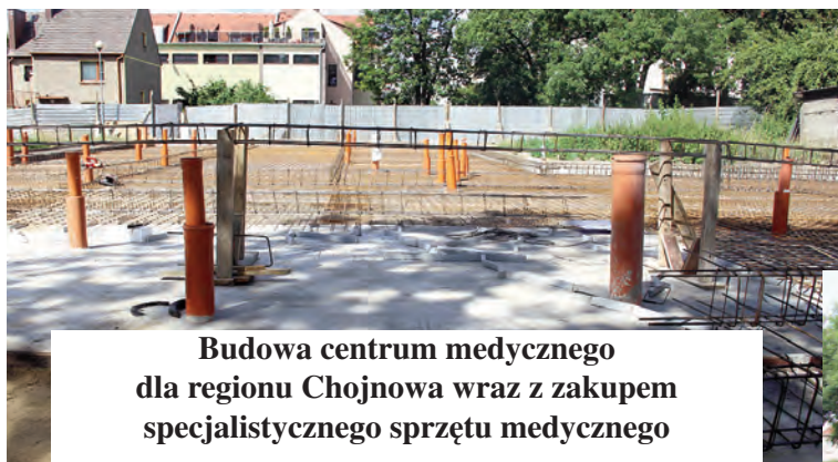
Budowa centrum medycznego dla regionu Chojnowa wraz z zakupem specjalistycznego sprzętu medycznego