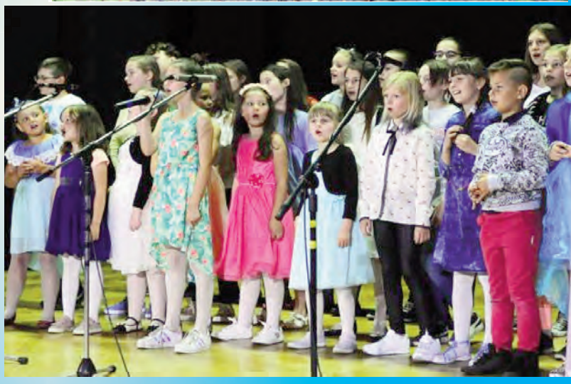
W krainie Muzycznych Snów