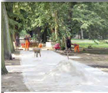
Prace konserwatorskie w obrębie zabytkowego Parku Śródmiejskiego