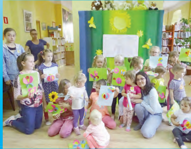
Biblioteczna Akademia Malucha Bajka o żółtej kredce