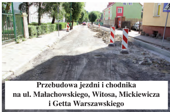
Przebudowa jezdni i chodnika na ul. Małachowskiego, Witosa, Mickiewicza i Getta Warszawskiego

* Rozpoczęto procedurę projektową dla zadań, które będą realizowane z Budżetu Obywatelskiego: Remont sceny i nawierzchni towarzyszącej - Park Piastowski Wzgórze Chmielowe oraz Rewitalizacja Amfiteatru w Parku Śródmiejskim.