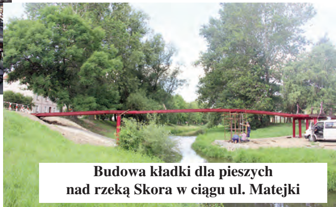
Budowa kładki dla pieszych nad rzeką Skora w ciągu ul. Matejki