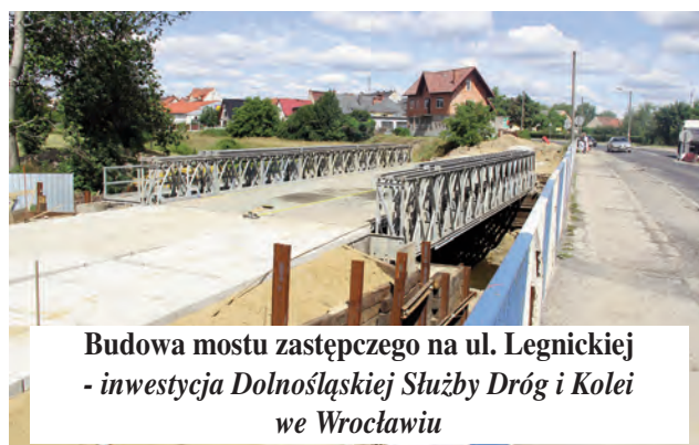
Budowa mostu zastępczego na ul. Legnickiej - inwestycja Dolnośląskiej Służby Dróg i Kolei we Wrocławiu

* Wykonawca inwestycji - budowa oświetlenia drogowego w ul. Legnickiej na odcinku od ul. Reja do ul. Żeromskiego, przygotowuje projekt organizacji ruchu drogowego.