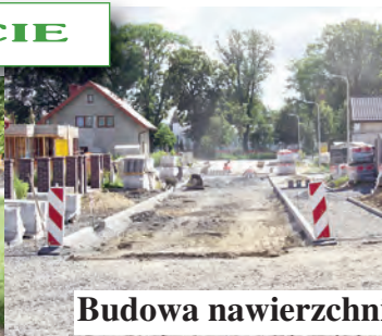
Budowa nawierzchni ulicy Solskiego