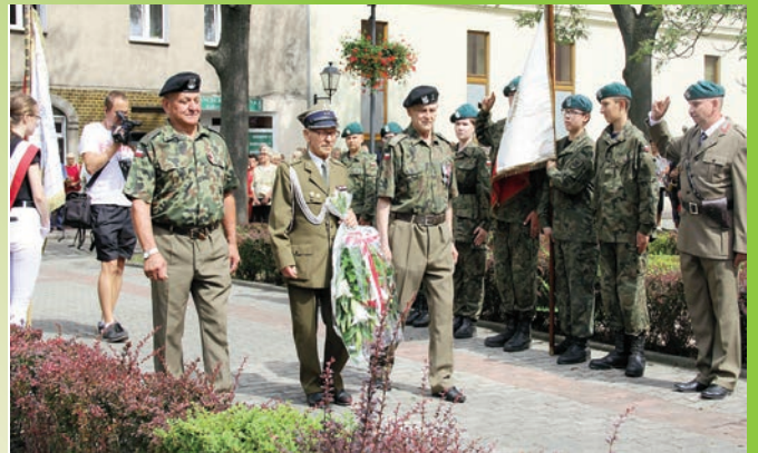
15 sierpnia w Chojnowie