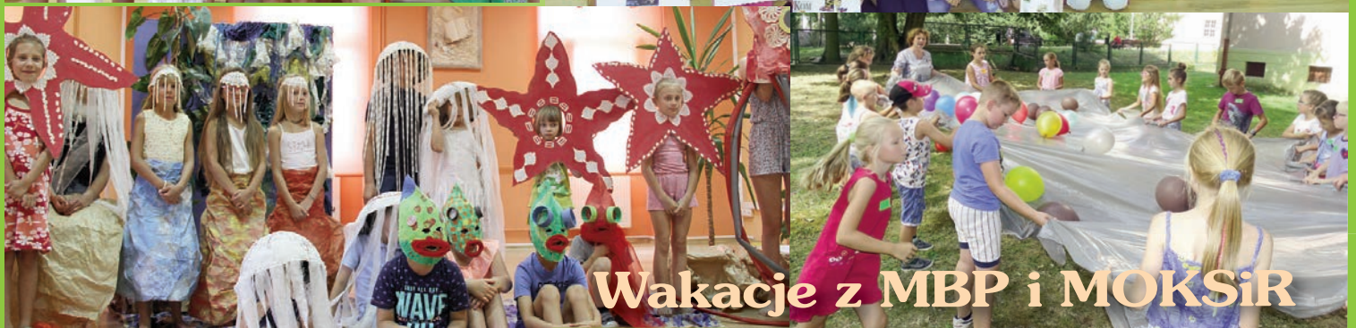
Wakacje z MBP i MOKSiR