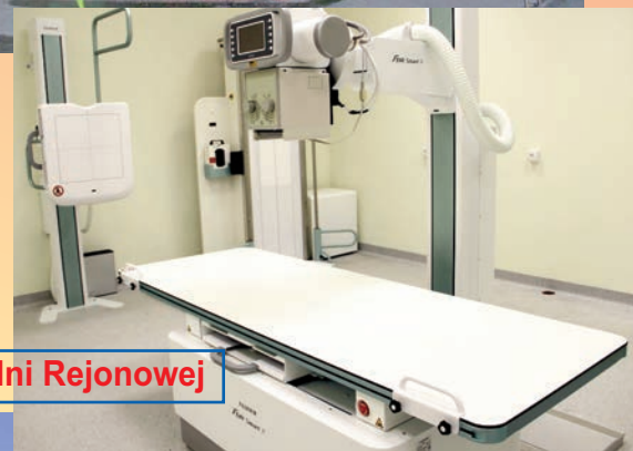
Centrum Medyczne przy Przychodni Rejonowej