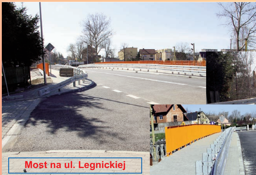
Most na ul. Legnickiej