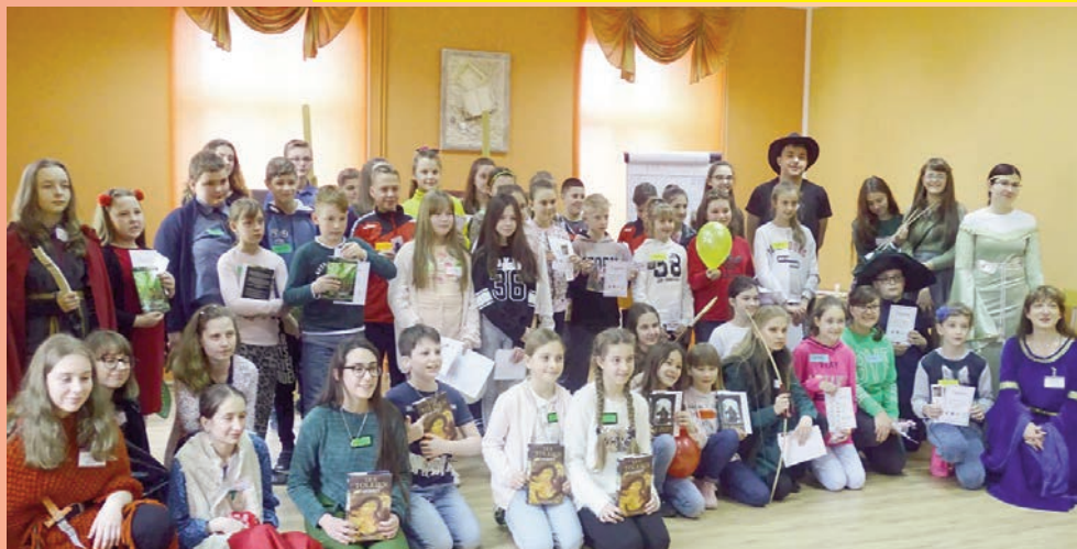
Światowy Dzień Czytania Tolkiena - odkrywanie tajemnic w MBP

NR 07 (924) ROK XXVII 05.04.2019 CENA 1,70 zł