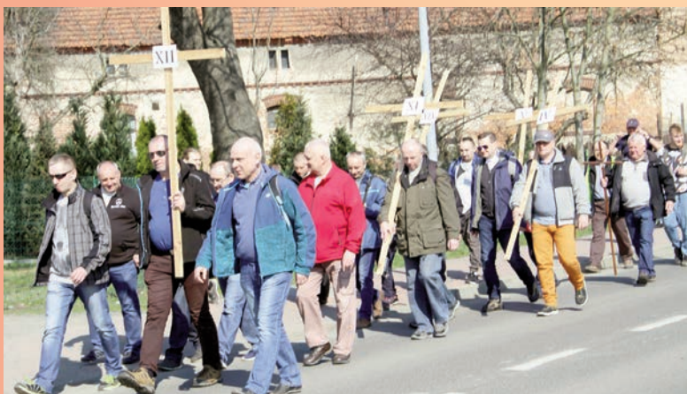
Synowie, ojcowie i dziadkowie w intencjach rodzin