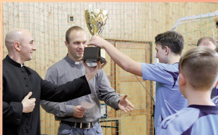
Chojnowo gospodarzem Ministranckich Mistrzostw w Piłce Nożnej