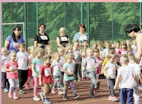
„Rozbiegany przedszkolak” w Przedszkolu nr 3