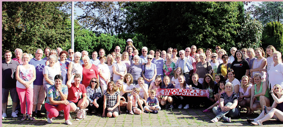
Wizyta w partnerskim Egelsbach