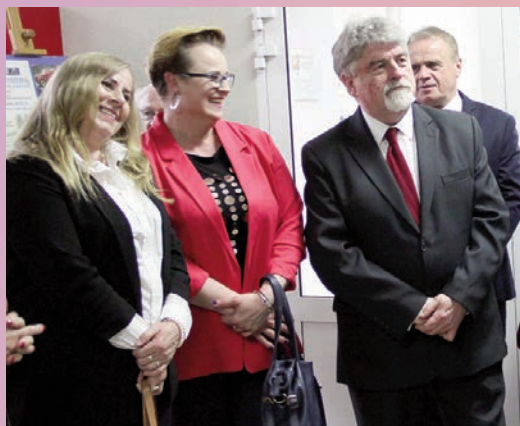
Jubileusz 30. lecia firmy UNIFOT