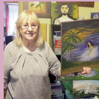
Z cyklu „Ludzie z pasją” Józefa Pawlak

NR 11 (928) ROK XXVII 07.06.2019 CENA 1,70 zł