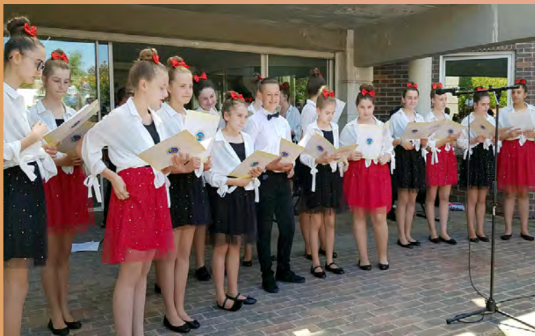
Wizyta we francuskim Commentry

Z cyklu „Ludzie z pasją” Daria Tkaczyszyn-Kaluźna