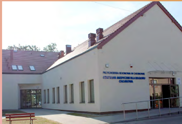
Centrum Medyczne dla Regionu Chojnowa otwarte