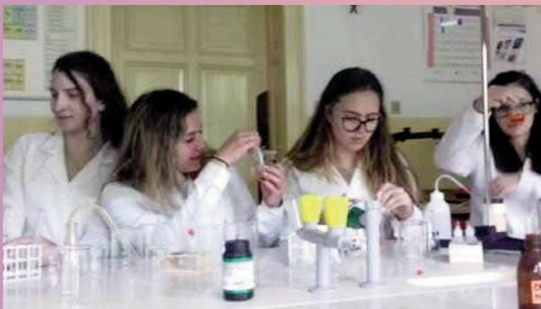
W PZS dzieje się