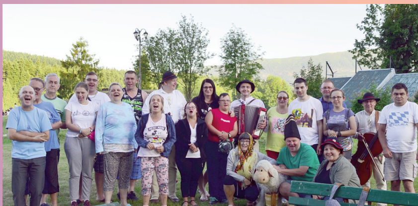
Wypoczynek i edukacja Warsztat Terapii Zajęciowej w Zawoi