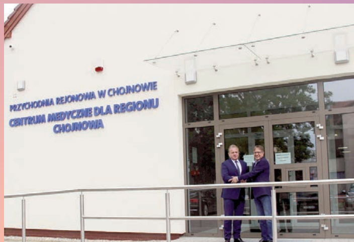
Główny wykonawca w centrum medycznym