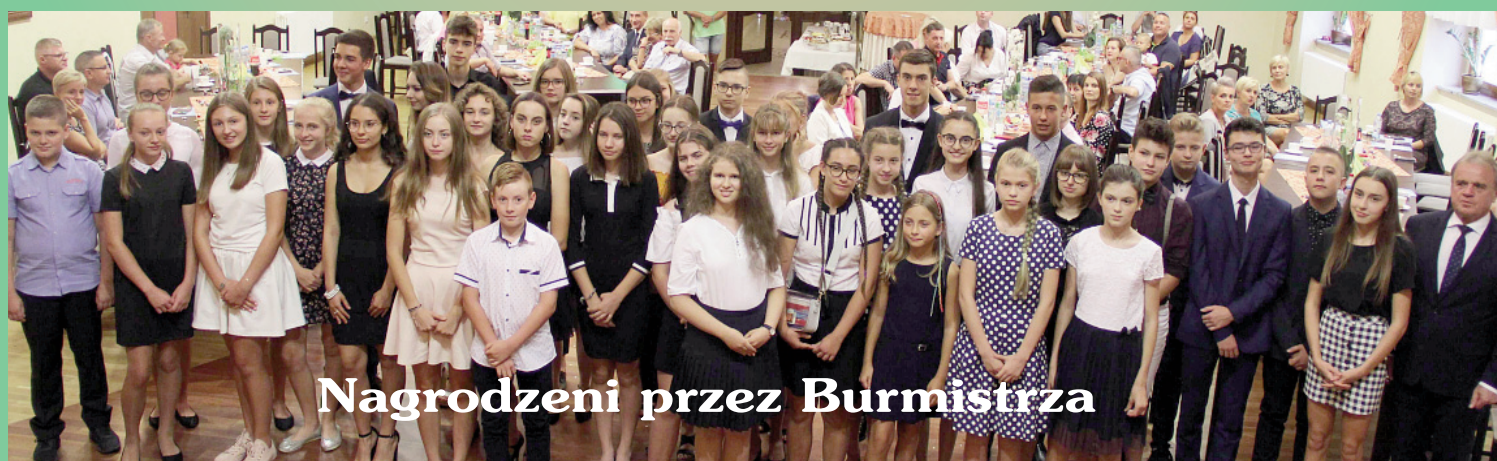
Nagrodzeni przez Burmistrza