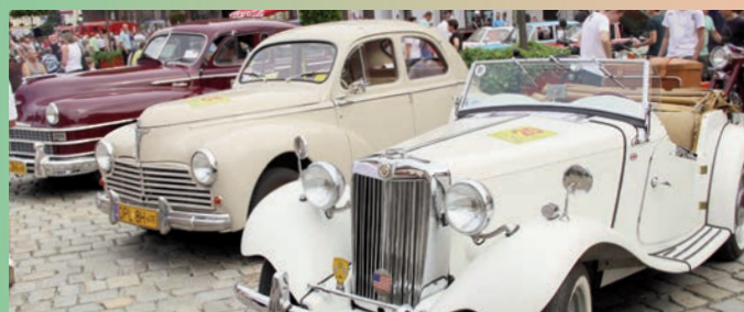
IV Rajd Złot Pojazdów Zabytkowych