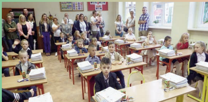
Rozpoczęcie nowego roku szkolnego 2019/2020