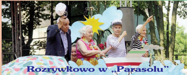
Rozrywkowo w „Parasolu”