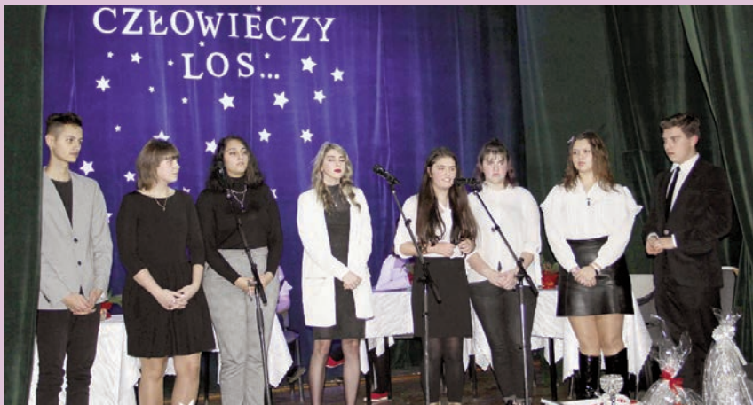
Ludzi dobrej woli jest więcej - koncert charytatywny PZS