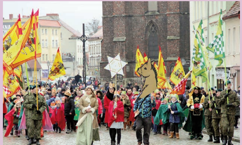
Orszak Trzech Króli