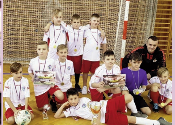
Turniej w Czechach wygrany!