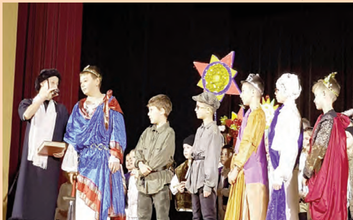
Łemkowskie i ukraińskie kołędowanie