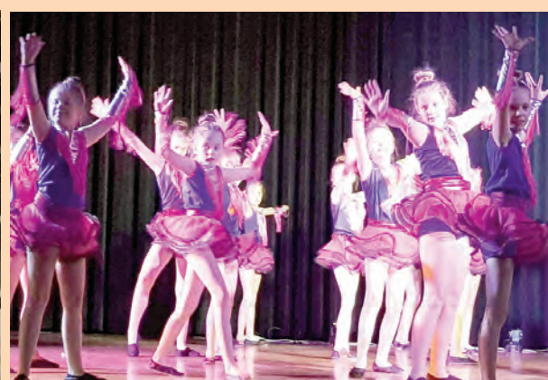
Z wiatrem w żaglach - WOŚP 2020