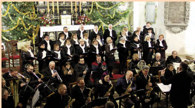
Z kołędą do Was idziemy

NR 02 (942) ROK XXVII 24.01.2020 CENA 1,70 zł