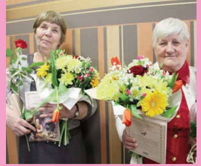
Piękne jubileusze w ZINR

NR 05 (945) ROK XXVIII 06.03.2020 CENA 1,70 zł