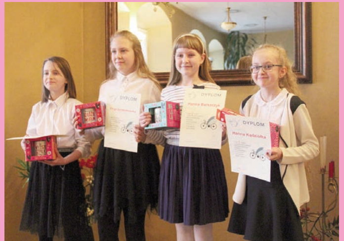
25. edycja Pegazika - eliminacje miejskie