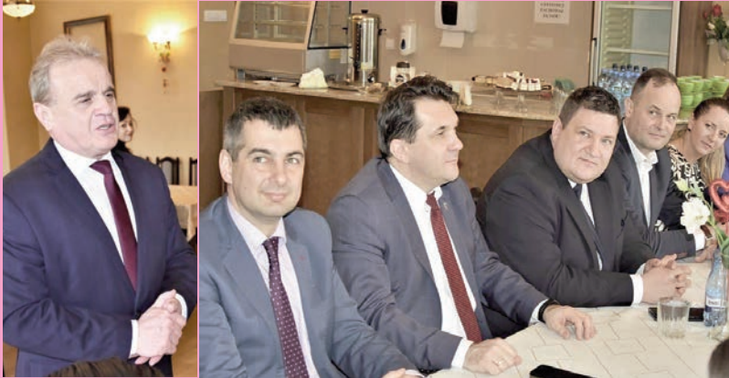
Na konwencji o inwestycjach i futbolu