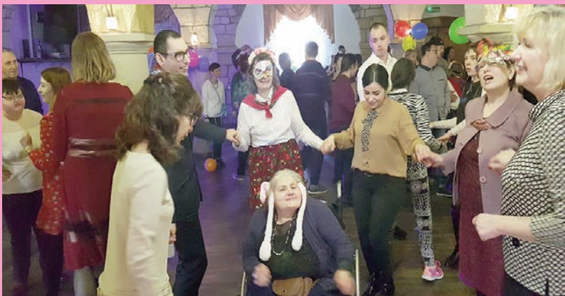
Niezapomniany bal karnawałowy ŚDS nr 2