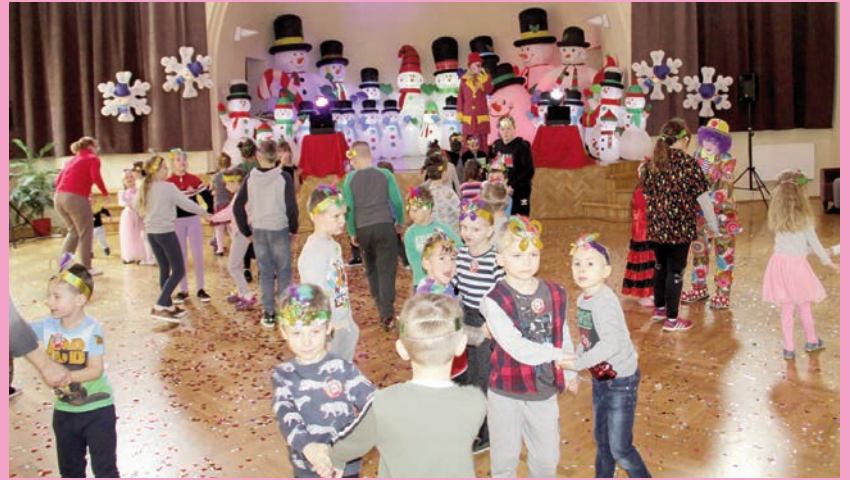
Ferie z MOKSiR