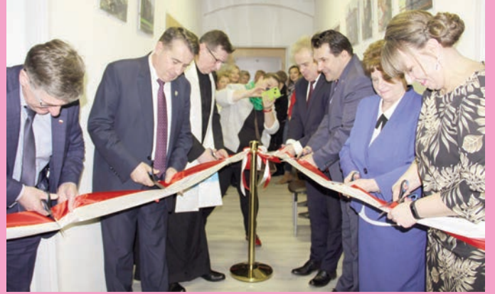
„Sale doświadczania świata” w ŚDS nr 1 w Chojnowie