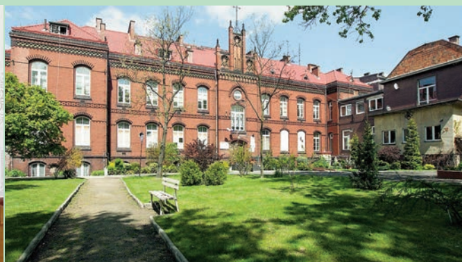
O sytuacji w Niebieskim Parasolu