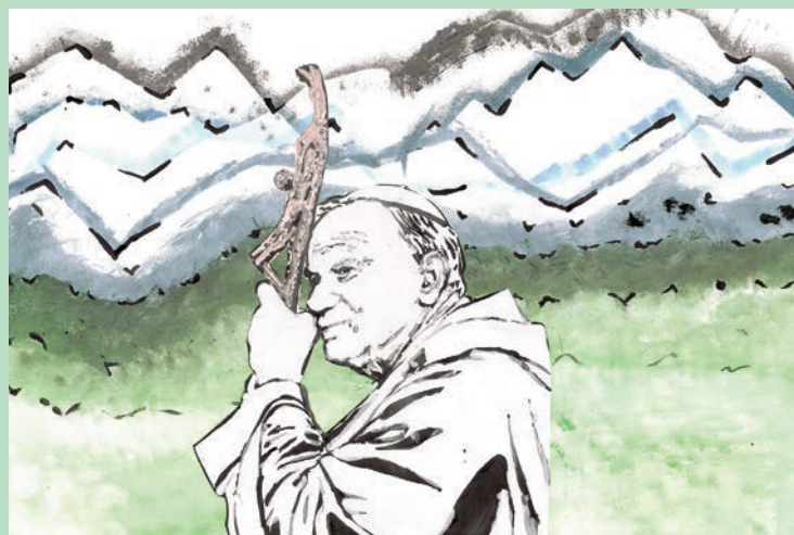
Konkurs Stowarzyszenia Rodzin Katolickich Diecezji Legnickiej