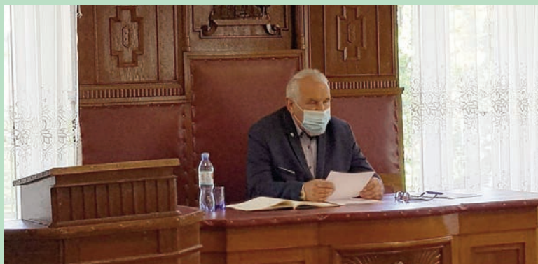
Na XXVII sesji Rady Miejskiej

NR 11 (951) ROK XXVIII 05.06.2020 CENA 1,70 zł