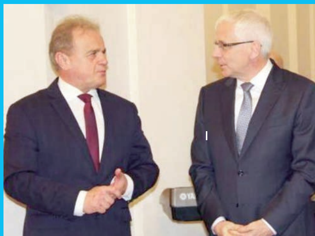
Jarosław Obremski - wojewoda dolnośląski z wizytą w Chojnowie