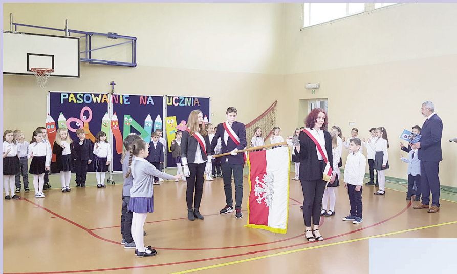
Pasowanie na ucznia w Trójce