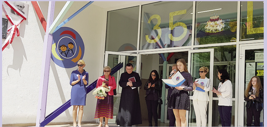
Razem możemy więcej! - z okazji 35. lecia Szkoły Podstawowej nr 4