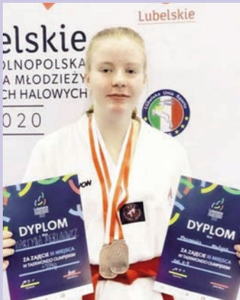
Utytułowane zawodniczki taekwondo