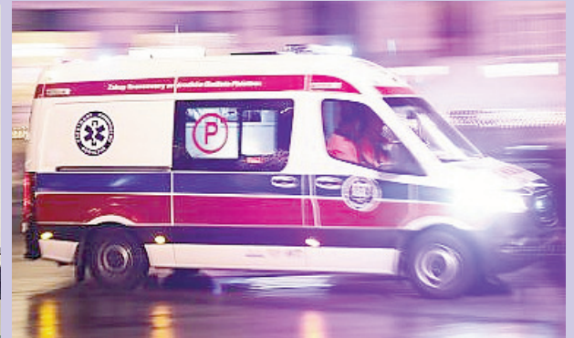
Tablety dla pogotowia