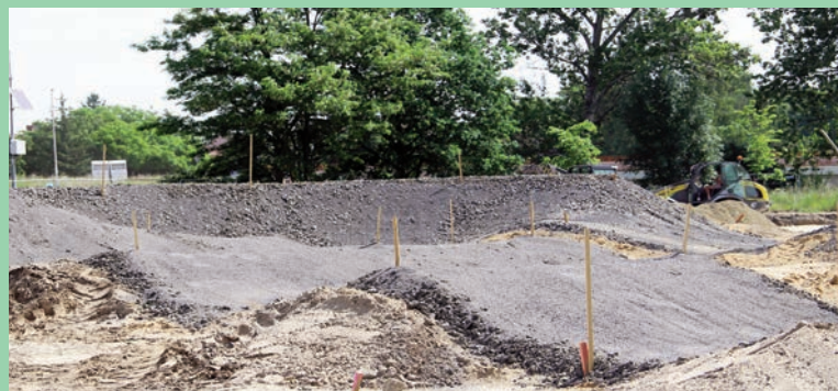
Budowa Skateparku i Pumptracka