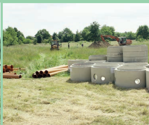
Budowa sieci wod.-kan. przy ul. Sikorskiego