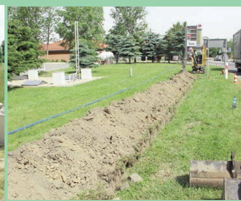
Oświetlenie przy ul. Legnickiej