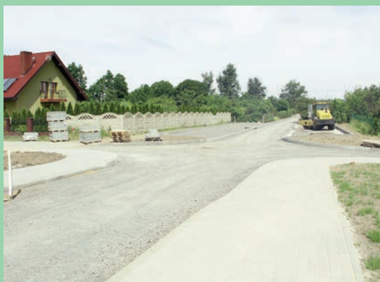
Budowa ul. Bielawskiej

Miasto otrzymało 300.000,00 zł na przebudowę istniejącego zbiornika na komorę tlenowej stabilizacji osadu nadmiernego na terenie oczyszczalni ścieków w Goliszowie z Rządowego Funduszu Inwestycji Lokalnych