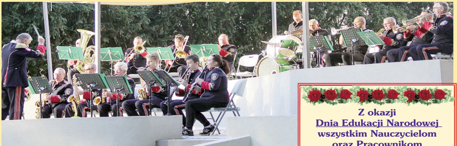
„Muzykowanie nad Skorą” - Koncert Miejskiej Orkiestry Dętej z Bolesławca