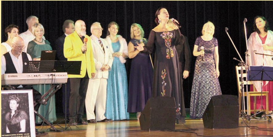
„Tylko czułość idzie do nieba” - romans polsko-rosyjski w Chojnowie