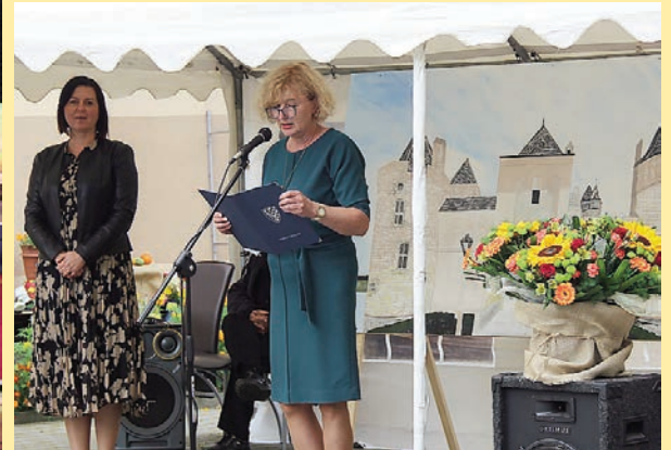
Wszyscy jesteśmy z tej samej gliny... - 10.lecie SDS nr 2