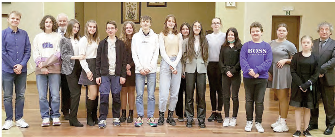
Młodzieżowa Rada Miejska Chojnowa wybrana!