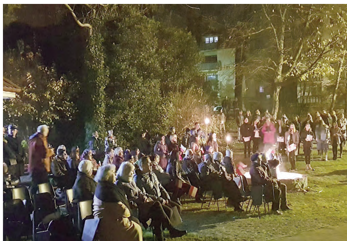
Ognisko Patriotyzmu w PZS