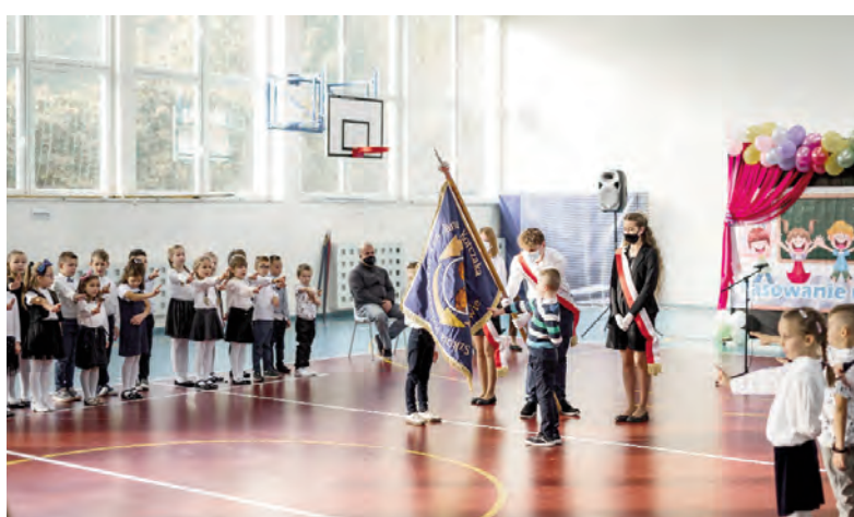
Pasowanie na Ucznia w SP4