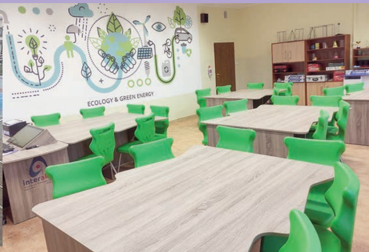
Pracownia przedmiotowa Interatkin