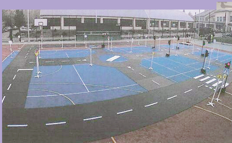
Mobilne miasteczko rowerowe