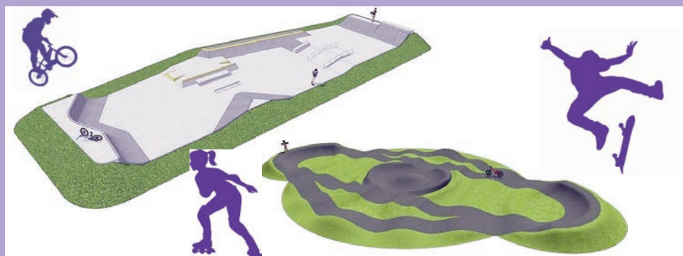
11 marca otwarcie pumtracka i skateparku