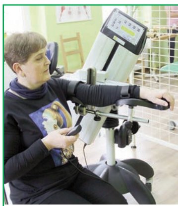
Nowy sprzęt w Rehabilitacji