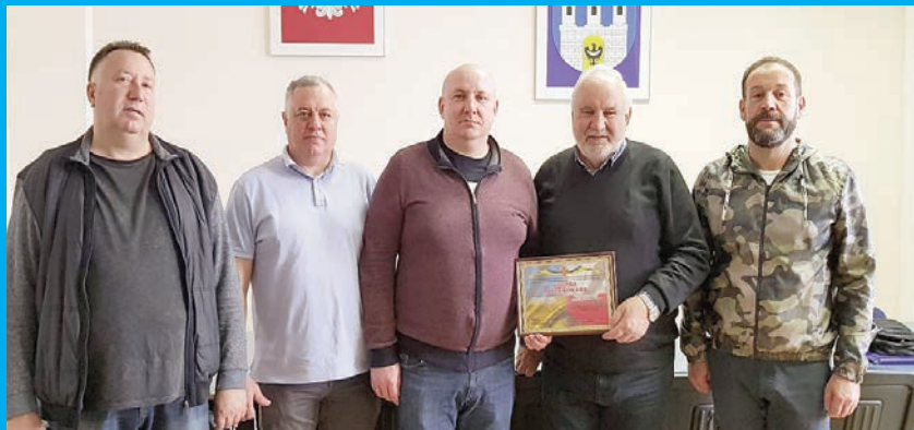
Wyjątkowi goście z Ukrainy