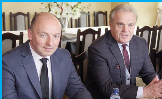
Wicemarszałek Województwa Dolnośląskiego – Tymoteusz Myrda na konwencji w Chojnowie