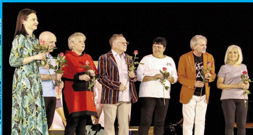
Jak wydać 5 milionów? - spektakl Antykwarjatu