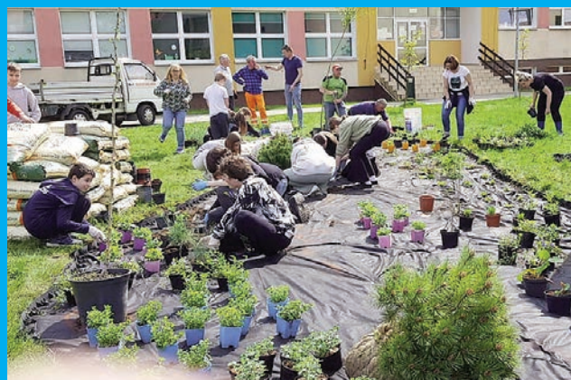
Modelowy ogród nektarodajny przy SP4