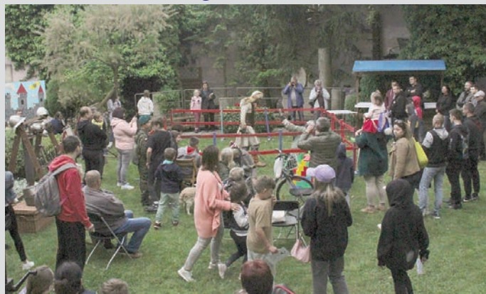
Noc Muzeów 2022