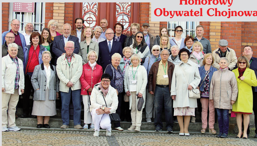
Wizyta na 15. lecie partnerstwa miast