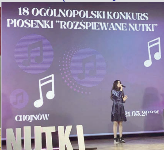
Rozśpiewane Nutki w MOKSiR