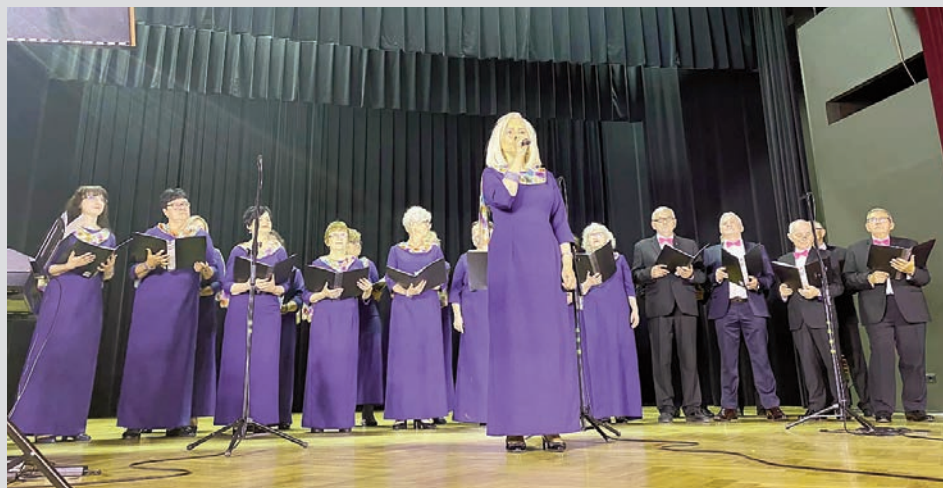
Koncert dla Mam