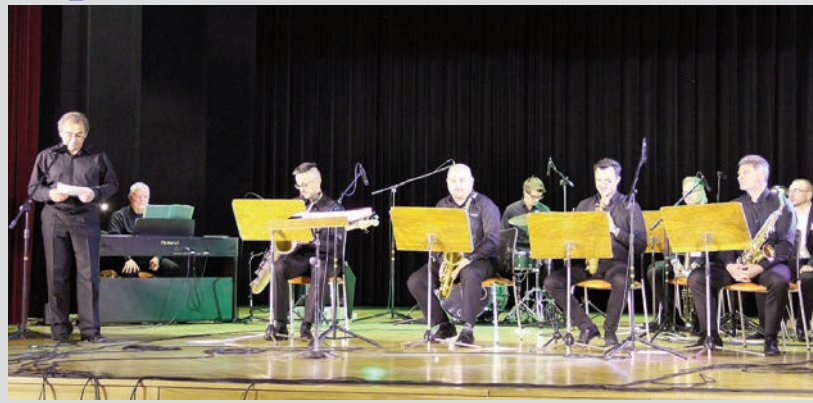
Koncerty nad Skorą - Benny Band