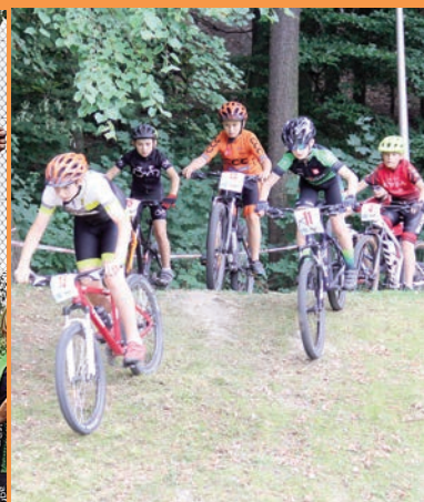
Liga Szkółek Kolarskich MTB