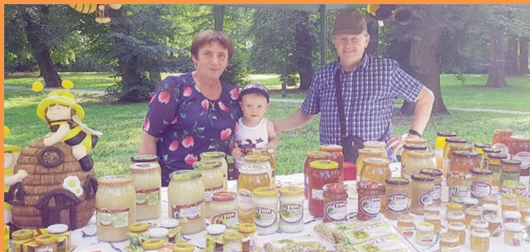
Słodkie zakończenie lata czyli II edycja Miodowego Lata