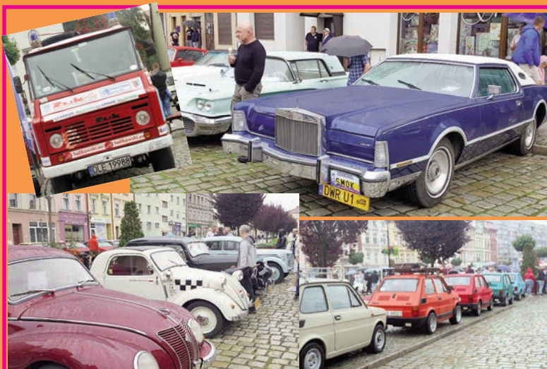
VI Zlot Pojazdów Zabytkowych