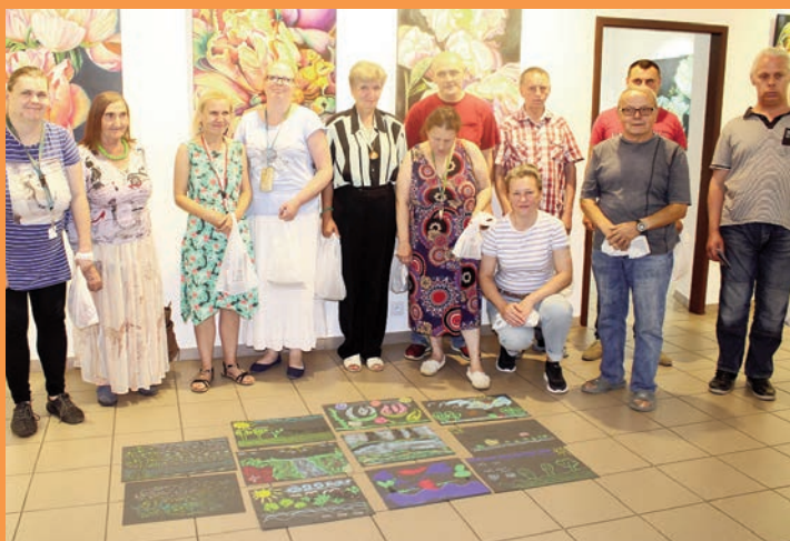
„Usłyszeć przeszłość - Dźwiękowy pejzaż Chojnowa” - projekt Muzeum Regionalnego wciąż trwa