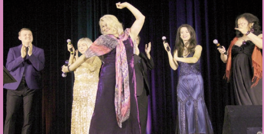
XI Festiwal JESIENNY ROMANS BARWY MIŁOŚCI RÓŻNYCH NARODÓW im. Lidii Nowikowej