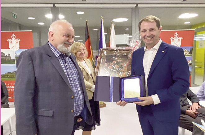
Święto Partnerstwa w Mnichovo Hradiště

NR 18 (1004) ROK XXXI 07.10.2022 CENA 1,70 zł