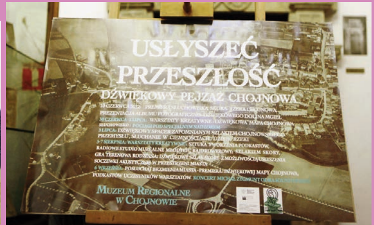
Podsumowanie projektu Muzeum Regionalnego