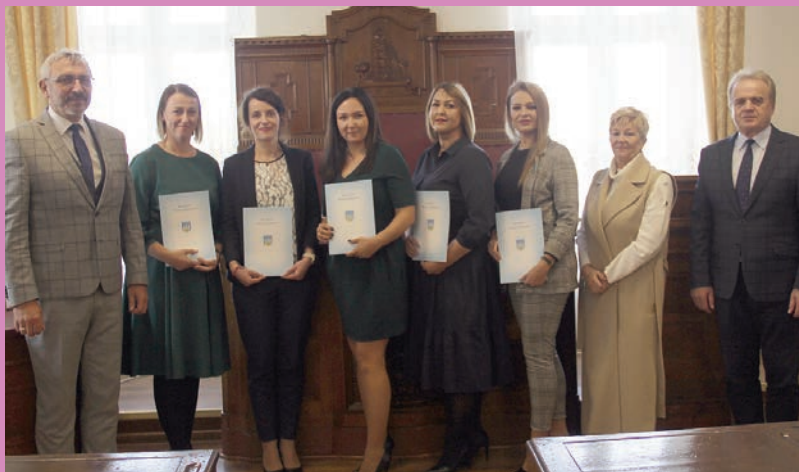
Awans zawodowy chojnowskich nauczycieli