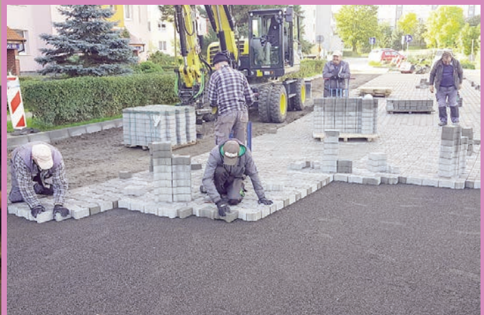
Inwestycje w mieście