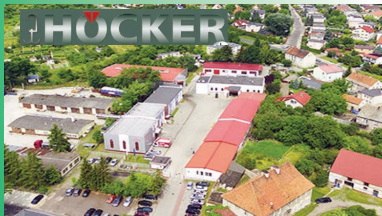
Höcker 30 lat w Chojnowie