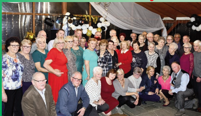
Andrzejki w ZERiI