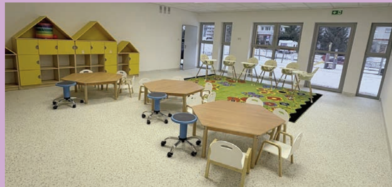
Żłobek Miejski większy o 24 miejsca