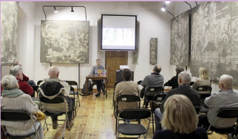
Watykan od środka