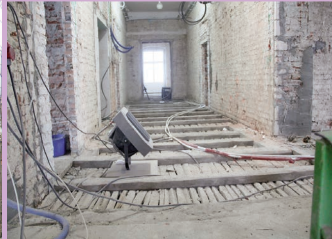
Centrum Usług Społecznych rośnie w oczach